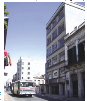
CEPRODIH, aquí se alojan más de 100 personas