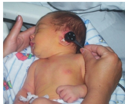
Examen de hipoacusia

Ambas organizaciones solicitaron que los fondos fueran canalizados para realizar mejoras en infraestructura. En el artículo siguiente se describen en detalle los proyectos en los cuales se vertieron estos fondos. En todos los casos Reaching U solicita presupuestos estimativos de la inversión, y luego de realizada la misma, se obtienen copias de las facturas o comprobantes de gastos. Dichas donaciones fueron posibles gracias a lo recaudado en la campaña semestral de marzo de 2005 y de diciembre de 2004.