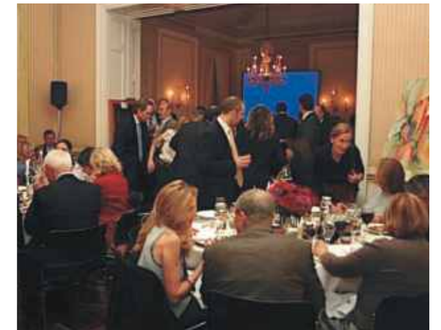
Remate de Arte Anual

Las entradas quedaron agotadas previo al evento y la capacidad del local, sede de la prestigiosa Americas Society, quedó colmada. Dada la crisis económica que azota actualmente a Estados Unidos, el monto de dinero recaudado - más de USD 40.000 - también excedió ampliamente las expectativas.