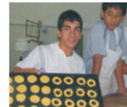
Jóvenes en el Taller de Confeitería

Ver la determinación de las personas que manejan este proyecto para mejorar la calidad de vida de sus niños y sus opciones para el futuro es sinceramente inspirador. Personalmente, una de las dudas más grandes al momento de ayudar es si el