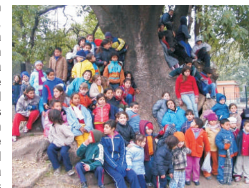
Niños de GURISAES

Los niños que asisten a Gurisaes típicamente viven en condiciones de hacinamiento junto con su madre, unos 5 hermanos hijos de padres diferentes y la pareja actual de la madre. Normalmente se alojan en casonas abandonadas y comparten entre todos una habitación. El tipo de problemática que viven se caracteriza principalmente por la delincuencia, el consumo y tráfico de drogas y la prostitución. Más del 50% de los niños que asisten a Gurisaes tienen problemas de malnutrición: su alimentación proviene básicamente de hurgar basura o pedir en la calle. El resto de la población padece de deficiencia alimentaria; su alimentación está basada en dulces financiados en su mayoría por la delincuencia y el